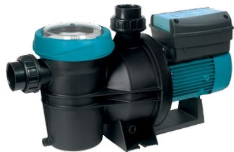
Silenplus 2M y 3M